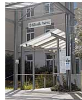
BILDER: KLINIKUM KONSTANZ UND PIXABAY / STAND: JANUAR 2022