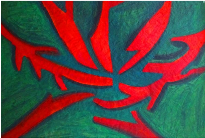
Gemälde von Krumbein (ausgestellt im ZSP Salzwedel)