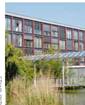
STAND OKTOBER 2020